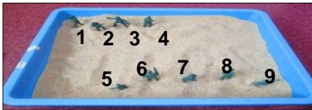
Rajah 2. Hasil kerja terapi bermain pasir “main perang-perang” Adam

Bagi sesi terapi pertama, fokusnya adalah pada hubungan Adam dengan ahli keluarganya melalui aktiviti “main perang-perang”. Adam telah diminta membentuk pasukan Adam dan pasukan musuh berdasarkan ahli keluarganya. Hasil kerja akhir Adam dapat diperhatikan pada dulang pasir seperti yang ditunjukkan pada Rajah 2. Jadual 2 pula memaparkan penerangan Adam perwakilan askar miniatur serta pasukan dalam aktiviti “main perang-perang”.